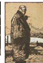
山本鼎《漁夫》(後刷り) 1988年(初版1904年)