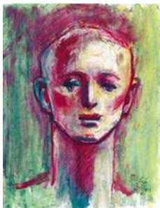
舟越桂《習作》2001年 サクラアートミュージアム蔵

クレパスは1925年(大正14)に誕生し2025年で100年を迎えました。数ある洋画材料の中でも日本で発明された唯一の描画材料です。本展では、クレパスの開発と普及に関わった画家・山本鼎をはじめ、梅原龍三郎、猪熊弦一郎、小磯良平、岡本太郎など、大正・昭和の時代に日本の美術画壇の中核で活躍した近代の巨匠たちから、舟越桂、鴻池朋子、加藤ゆわ、絹谷香菜子など、現代の作家が描いた新作クレパス画も一堂に展示します。