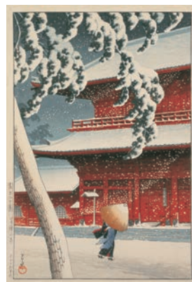
川瀬巴水《芝増上寺》東京二十景 1925年 渡邊木版美術画館蔵

大正から昭和にかけて活躍した木版画家・川瀬巴水(1883-1957〔明治16-昭和32〕年)。季節や天候、時の移ろいを豊かに表現し「旅情詩人」とも呼ばれた川瀬巴水の画家としての生涯を、初期から晩年までの代表的な作品とともに紹介します。