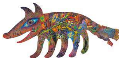
鴻池朋子《Little Wild Things》2015年 サクラアートミュージアム蔵