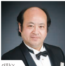
バリトン 志村文彦(フンディング)** Fumihiko Shimura