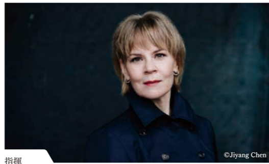
指揮 スザンナ・マルッキ Susanna Malkki

2008年にベルリン・フィルの指揮台にデビューし、その後も繰り返し客演している世界的なマエストロ、スザンナ・マルッキが振る「田園」&「春祭」。サントミュージゼで初の公演となる東京交響楽団の演奏をこの機会にぜひお楽しみください。