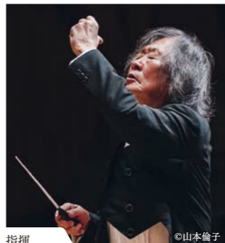
指揮 小林研一郎 Ken-ichiro Kobayashi

上田定期演奏会2025年度シーズンは、今年85歳を迎えるマエストロ・小林研一郎氏を迎えた「コパケンのペートーヴェン」で開幕。円熟のタクトに導かれペートーヴェンの神髄に迫る本公演。創立80周年を迎えた群響が、拠点のひとつとして慣れ親しむサントミュージゼで、オーケストラ音楽の最高峰「ペートーヴェン交響曲の世界」に今改めてどう向き合うか。交響曲の魅力に迫るこの公演にぜひご期待ください。